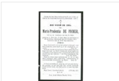
Dood van een dienstbode.