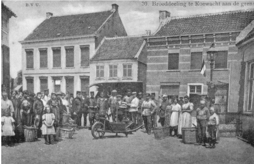
'De Brooddeeling te Koewacht aan de grens'

Als gevolg van de vlucht van ca. 1 miljoen Belgische inwoners naar Nederland in het najaar van 1914, ontstond in België een gebrek aan brood. Met de Duitse bezetters werd overeengekomen dat in Nederland gebakken brood aan de grens mocht worden overgedragen aan de in België achtergebleven bevolking. Mensen staan aan het begin van de Kerkstraat in Koewacht al klaar met manden en kruitwagens om het brood mee te nemen dat is aangevoerd met de bakkerskar op Nederlands gebied, achter de draad (midden op de foto). De grens is op deze foto nog afgezet met kippengaas dat in juni 1915 zal dat worden vervangen door de elektrische draad: 'den Doodendraad', waarop een spanning van 2000 Volt stond.