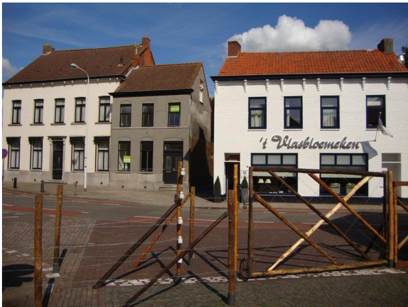
Voor de herdenking '100 jaar 'Den Doodendraad' Koewacht' op 12 september 2015 is een stukje van de draad gereconstrueerd met het doorgangshek, zoals dat ook exact op deze plaats heeft gestaan.

Als gevolg van de vlucht van ca. 1 miljoen Belgische inwoners naar Nederland in het najaar van 1914, ontstond in België een gebrek aan brood. Met de Duitse bezetters werd overeengekomen dat in Nederland gebakken brood aan de grens mocht worden overgedragen aan de in België achtergebleven bevolking. Mensen staan aan het begin van de Kerkstraat in Koewacht al klaar met manden en kruitwagens om het brood mee te nemen dat is aangevoerd met de bakkerskar op Nederlands gebied, achter de draad (midden op de foto). De grens is op deze foto nog afgezet met kippengaas dat in juni 1915 zal dat worden vervangen door de elektrische draad: 'den Doodendraad', waarop een spanning van 2000 Volt stond.