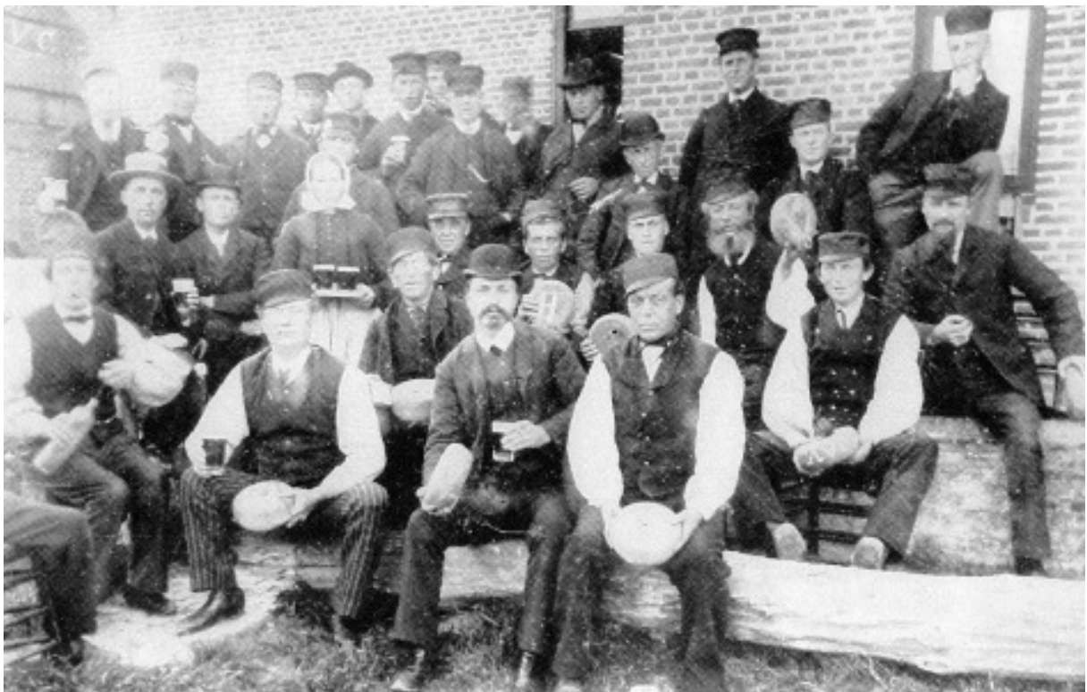
Bollers op de bolbaan in Zuidzande.

In de loop der tijd zijn er in het spel veranderingen opgetreden of doelbewust aangebracht. Deze veranderingen hangen deels samen met het gebruikte spelmateriaal. Als er met zowel stenen als schijven naar een staak geworpen wordt, zoals we hierboven bij Antonius van Torre in 1711 zagen, dan zullen de stenen vaak gegooid en de schijven gerold zijn. Blijkbaar maakte dat voor het spelverloop niet uit. Daarnaast werd vroeger achter de staak een lijn getrokken, waar de stenen of schijven niet achter terecht mochten komen, onder de sanctie dat men dan 'af' was. Ook de puntentelling was in de tijd van Van Torre gecompliceerder dan tegenwoordig. Trends in de ontwikkeling van het spel in de afgelopen driehonderd jaar lijken dus die naar eenduidigheid van het spelmateriaal en vereenvoudiging van de spelregels geweest te zijn.