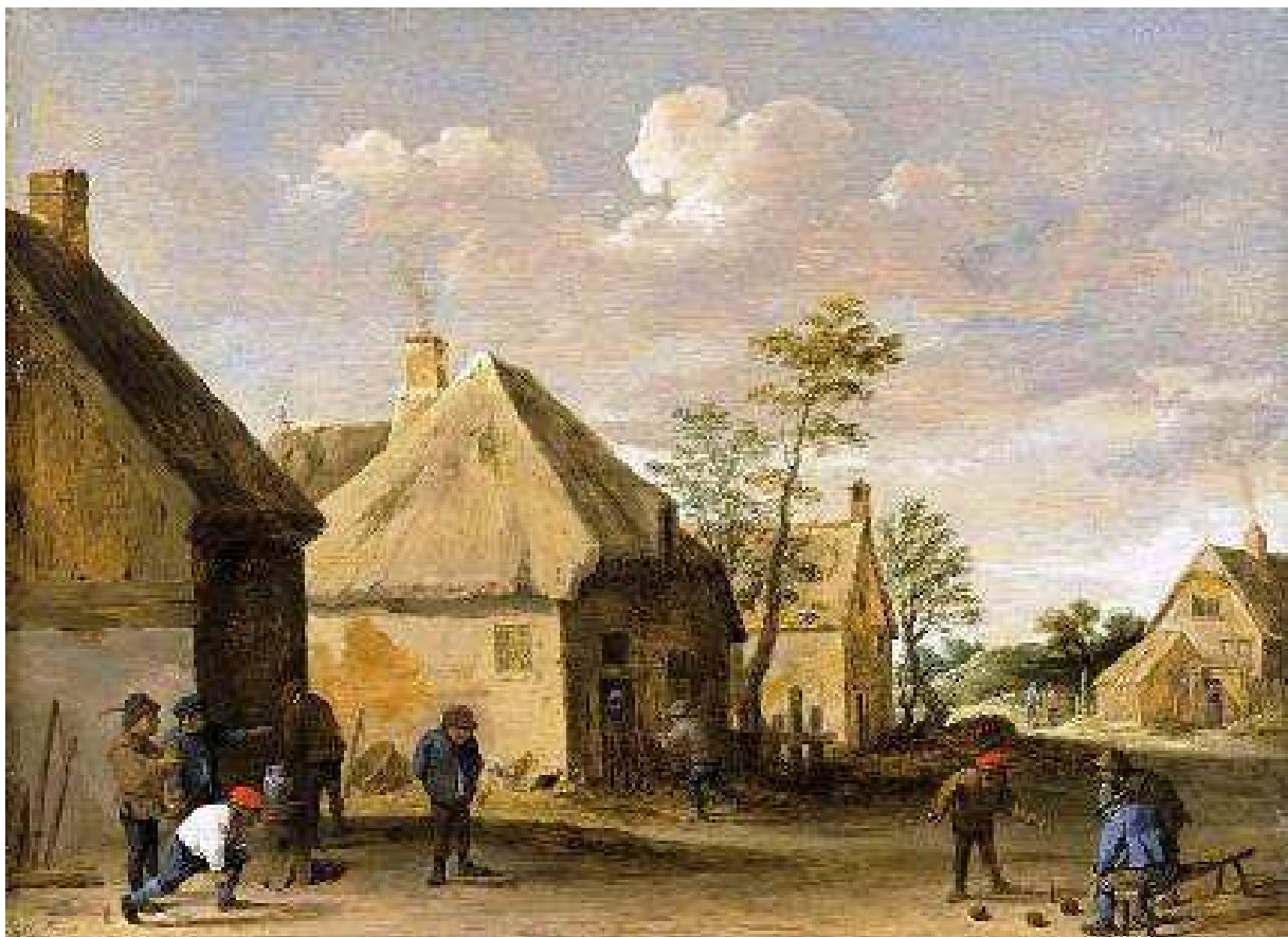
Krulbollen op schilderij David Teniers de Jonge.

Krulbollen, of bollen met de 'dikke' bol, is een werpspel, waarbij platte ronde schijven, die aan de ene kant wat meer afgerond zijn dan aan de andere, gerold worden naar een vast doel, de staak . Doordat de schijf eenzijdig afgedraaid is, beschrijft ze gedurende het rollen een boog in plaats van een rechte lijn. De bol, die het dichtst bij de staak komt, is de winnaar.