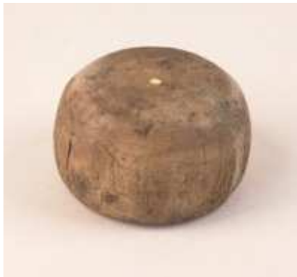
Krulbol uit de 14de eeuw.

archeologisch depot van de SCEZ bevinden, zouden dendrologisch onderzocht kunnen worden om over dit verband uitsluitsel te geven.