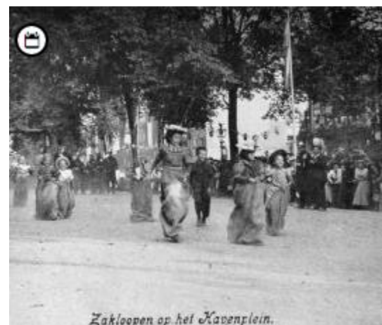
Zaklopen op het Havenplein.